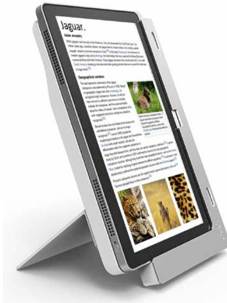
Das W700 von Acer lässt sich mit Hilfe der Docking-Station auch hochkant aufstellen.

Auf der Computex im taiwanischen Taipeh haben erste Hersteller Tablets mit dem Betriebssystem aus dem Hause Microsoft gezeigt. Acer präsentierte mit dem „W700“ und dem „W510“ zwei Windows-basierte Tablet-Modelle. Sie unterscheiden sich in erster Linie durch die Display-Größe. Während das W700 den Nutzern eine 11,6 Zoll große Anzeige bietet, die das Bild mit 1920 mal 1080 Bildpunkten auflöst, stattdessen der Hersteller das kleinere Modell W510 mit einem Zehn-Zoll-Display aus. Das kleinere Modell lässt sich mit einer ansteckbaren Tastatur erweitern. Der dort integrierte Zusatzakku soll die Betriebsdauer auf bis zu 18 Stunden verlängern. Für das W700 hat Acer eine Docking-Station im Programm, mit der sich das Tablet in einem Winkel von 20 bis 70 Grad aufstellen lässt und die zusätzliche Schnittstellen bieten soll. Standardmäßig bieten beide Acer-Tablets USB-Ports, eine HDMI-Schnittstelle sowie einen Speicherkarten-Steckplatz.