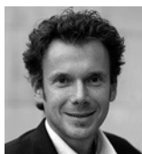
Von Martin Bayer, stellvertretender Chefredakteur

Die Sieger der Best-in-Big-Data-Awards 2014 stehen fest. In einem spannenden Finale setzte sich Swisscom in der Kategorie Projekte durch. Den Preis für die beste Big-Data-Lösung sicherte sich der Softwareanbieter Datameer.