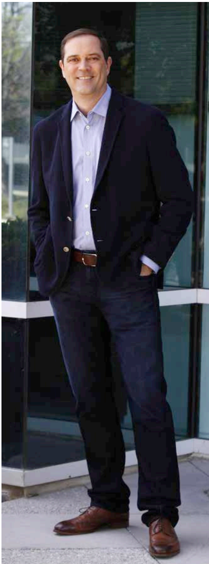
Cisco-CEO Chuck Robbins verspricht den Anwendern im Zuge der Cloud-Kooperation mit Google Agilität und Skalierbarkeit auf Enterprise-Niveau.

Cisco kauft für 1,9 Milliarden Dollar den auf Unified-Communications-Lösungen spezialisierten Anbieter Broadsoft. Es ist die 200. Akquisition in der Firmengeschichte. Außerdem wurde eine Cloud-Zusammenarbeit mit Google vereinbart.