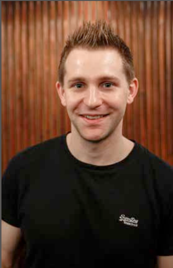
Datenschützer Max Schrems hat vor dem EuGH Recht bekommen und leitet nun erste Beschwerden ein.